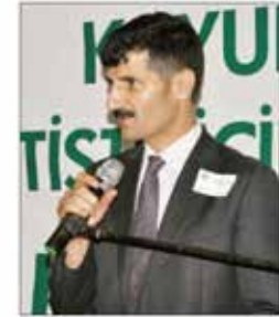
veya sigortası yatırmaları halinde 2015 yılında bakanlıktan 5 bin lira destek alabilecek" dedi. (İHA)

cak kurs için başvurular başladı. Kursu katılmak isteyenler Elazığ merkez, Maden, Keban, Baskil, Sivrice, Ağın için başvurular İl Halk Eğitim Merkezi Müdürlüğü'ne 26 Eylül Cuma günü mesai bitimine kadar başvurabilecek. İlçelerdeki yoğunluk ve potansiyeli de göz önünde bulundurarak Karakoçan ve Kovancılar dahil olmak ilk etapta eğitimde kurs açılacak. Bu bölgedeki ilçelerimiz olan Palu, Arıcak, Alacakaya'daki eğitimlerimiz 10 Ekim Cuma günü mesai bitimine kadar Karakoçan ve Kovancılar Halk Eğitim Müdürlüklerine başvurularını gerekmektedir. 500 kişiye kadar hayvana sahip işletme sahiplerinin veya birinci derecedeki yakınları dahil olmak üzere eğitime katılmı ve sonunda sertifikasını almış sürü yönetimi elemanı işletmesinde en az 5 ay tarım Bağkur'u