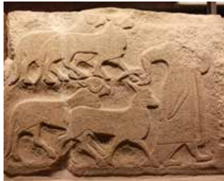
Şekil 1. Alacahöyük kabartmaları MÖ. 1399-1301

Türkiye'de toplam tarımsal üretim değeri içerisinde hayvansal üretimin payı yaklaşık % 32 dir 1 . Yerli ırklar üretim çevresine uyum, geleneksel/özel ürün, organik üretim potansiyelleri, geleneksel üretimden kaynaklanan bilgi birikimi ve tarım için elverişsiz alanları değerlendirebilmeleri nedenleriyle ekonomik açıdan önemlidirler. Ayrıca, hastalıklara direnç, çevreye uyum ya da verim ile ilişkilendirilmiş olan genetik özellikleri bakımından sahip oldukları kimi genler, güncel bilimsel çalışmalarda çok önemli yer tutmaktadır. Arkeolojik kalıntılar koyun ve keçinin Anadolu'ya yakın bölgelerde evcilleştirildiğini göstermektedir. Anadolu'nun farklı çevresel koşulları, coğrafi yapısı ve hayvan yetiştiricilerinin tercihleri şu anda sahip olduğumuz HGK zenginliğine katkı yapmıştır. Verimli Hilal olarak adlandırılan bu coğrafi bölge, dünyada evciltmenin önemli bir merkezi olarak kabul edilmektedir 2 . (Şekil 1)