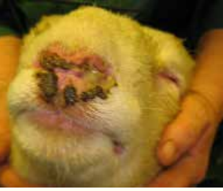
İrinli burun akıntısı