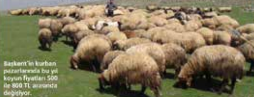
Başkent'te kurban pazarlarında bu yıl koyun fiyatları 500 ile 800 TL arasında değişiyor.

Türkiye Kasaplar Federasyonu Başkanı Fazıl Yalçınoğlu, Anadolu topraklarında geleneksel olarak koyun ve keçi yetiştirildiğini ancak son yıllarda büyükbaş hayvanların arttığını belirterek, "Büyükbaşın fiyatı yükseldi. Üzüz et yememinin siri koyunda. Bu konuda tevdikler daha da artırmalı" dedi. Haberî sayfa 5'te