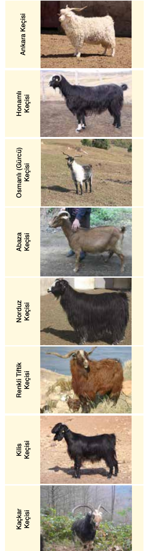
Şekil 3. Halk elinde korumaya alınan Türkiye yerli keçi ırkları