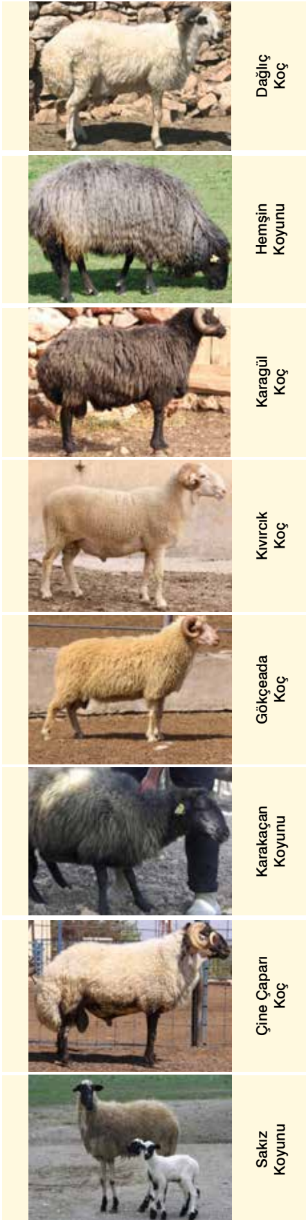
Şekil 2. Halk elinde korumaya alınan Türkiye yerli koyun ırkları

yoğunlaşırken, toplam keçi varlığı içerisindeki payı oldukça az olan süt tipi keçiler çoğunlukla Batı Anadolu bölgesinde yetiştirilmektedir. Yerli keçi genetik kaynaklarından Kıl keçisi için tehdit bulunmadığı, Ankara, Malta ve Norduz keçilerinin risk kategorilerinde değerlendirilmiştir 3 . Ankara, Honamlı, Osmanlı (Gürcü), Abaza, Norduz, Renkli Tiftik, Kilis ve Kaçkar keçi ırklarının yetiştirildiği bölgelerde koruma ve tanımlama çalışmaları devam etmektedir (Şekil 3).