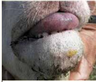
Ağızdan taşan dil